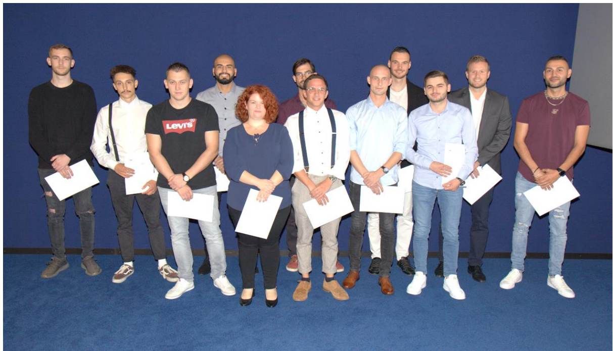
Photos des participantes-ts des lauréates-ts de Contremaître d'industrie