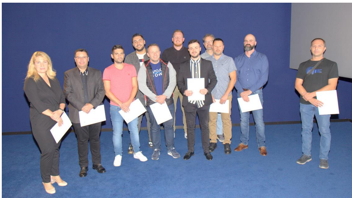
Photos des participantes-ts des lauréates-ts de Cheffe/Chef d'équipe d'industrie